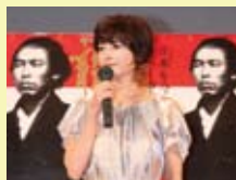
真木よう子 Maki Yoko

Profile / 2001年、映画『DRUG』でデビュー。『バッチギ!!』など多くの映画に出演、2006年には映画『ゆれる』で第30回山路ふみ子映画賞 新人女優賞を受賞。さらにTVドラマ『SP 警視庁警備部警護課第四係』の好演で注目を集める。今年10月には『SP 野望篇』映画版が上映。