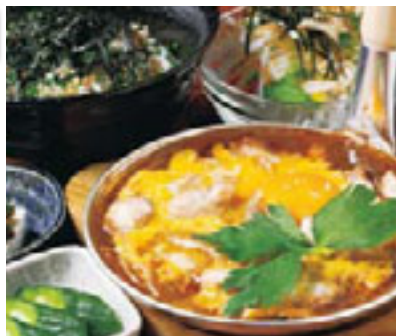
栄養バランスも考えられた「軍鶏親子御膳」。

●「京急大津」駅から徒歩3分。11時30分～13時30分(L.O.)、17～23時(L.O.)、水曜日定休。横須賀市大津町 2-1-27 / Tel.046-833-7299