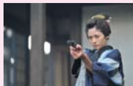
龍馬から託されたピストルを手に、想いを募らせる姿に注目したい

日本の夜明けが近づく物語は佳境へ 龍馬とおりよしのドラマは、いよいよ激動の幕末へ。おりよしと訪れた霧島で日本を変えると誓いを新たにした龍馬は、海援隊の設立に船中八策、さらに大政奉還へと時代のうねりに飛び込んでいく。