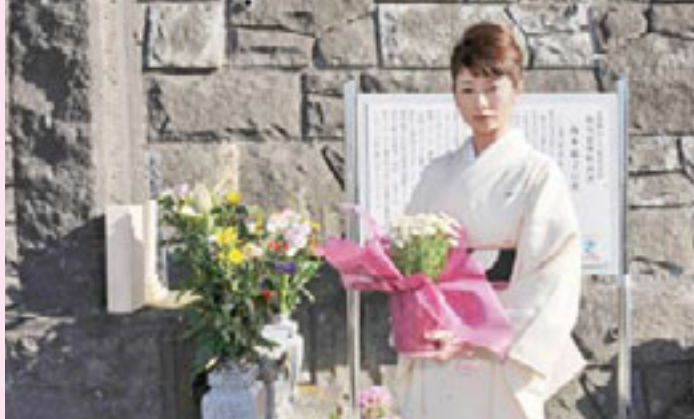
命日に訪れた信楽寺では役者として演じることを墓前に報告。役への集中を深めた