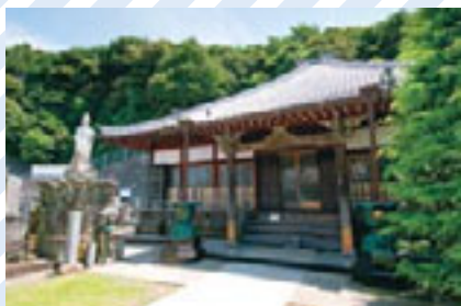
◎信楽寺、大津コミュニティセンター（横須賀市大津町3-18-13）。入場無料。大津観光協会 / Tel.046-836-3531

毎年10月に行われる墓前祭。当日は、13時30分から信楽寺・本堂で「坂本龍子墓前祭」が営まれるほか、大津コミュニティセンターでよこすか龍馬会月琴部の「月琴演奏」（15時～16時30分）なども開催。また、同センターでは10月1日(金)～10日(日)に、NHK大河ドラマ『龍馬伝』の「龍馬とおりょうさんパネル展」(10～16時)のほか、おりょう役・真木よう子さんの「お龍 真木よう子写真展」も実施される。