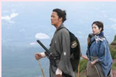
高千穂峰では雄大な自然の中、新婚旅行を熱演

ドラマの撮影に入る前、おりようの命日にあたる1月15日に信楽寺へも足を運んだ真木さん。墓前では、「自分のことだけでは失礼にあたるかと思いい、おりようさんを演じることのご報