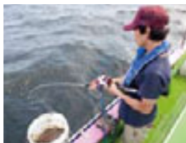
「大津港 小川丸」の乗合船で海釣りへ出航。ライフジャケットは無料で貸してくれる。釣り初体験の隊員でも、アジやサバが簡単に釣れた!

大津港で海釣りに挑戦果たして釣れるのか!? 京急大津駅から5分ほど歩くと大津港。ここでは海釣りを楽しむ。釣り船屋「 大津港 小川丸 」は、道具のレンタル(5000~10000円)もでき、手ぶらでOK。料金は半日コース(4時間)