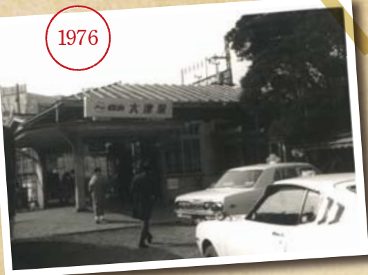
写真は1976(昭和51)年当時だが現在に通じる駅舎の様子がうかがえる。右手には稲荷の姿も。

開業当時は浦賀から海岸沿いを延長し、三崎口へ至る路線計画が進行中。しかしトンネル掘削などに時間がかかる。同ルートよりも、堀ノ内から線路を分岐させて三崎口へ至る現在の久里浜線ルートが優先され、1942(昭和17)年に京急久里浜駅までが開通。同時に新大津駅(当時は鳴神駅)が開業した。